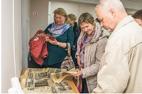
За каждым экспонатом музея тянется шлейф истории

18 апреля в библиотеке им. М.В. Фрунзе состоялось открытие краеведческой экспозиции «Купчино. От деревни до района». Выставка разместились на втором этаже библиотеки, в маленькой комнатке в конце длинного коридора, но местные краеведы восприняли это как добрый почин: наконец в огромном Фрунзенском районе появился музей, посвященный истории сердца района – Купчино.