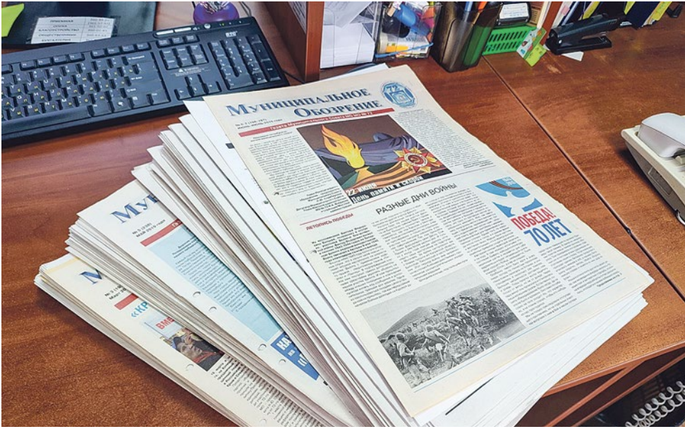
Подшивка газеты «Муниципальное обозрение».