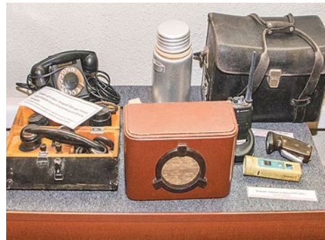
Истории 48-й паровозной колонны посвящена большая экспозиция в музее депо

Из-за обстрелов каждый их рейс на Большую землю и обратно был смертельно опасен. Мемориальная доска