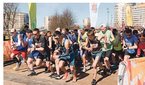
Старт на дистанцию 10 км