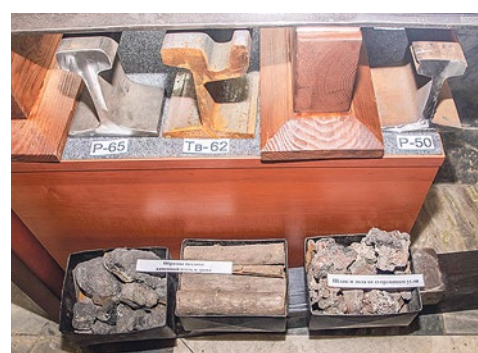
Экспонаты музея – подлинные вещи работников депо