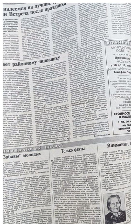
Газета «Муниципальное обозрение» № 2, июль 1999 года.

19 августа. Слов нет, эскизы пешеходной зоны (на улице Турку) производят самое положительное впечатление. В центре зоны планируется строительство большой ротонды для отдыха горожан. Если появится возможность подключения к магистрали водоснабжения, то в перспективе будет и свой фонтан. В начале зоны (угол Турку и Бухарестской) специалисты-проектировщики «Метростроя» запланировали выход из будущей станции метрополитена «Международная». Здесь же планируется разместить летнее кафе «Летающая тарелка». Материал, заложенный в проект кафе – лексан, легкий и небьющийся.