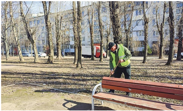
Уборка в рамках месячника по благоустройству