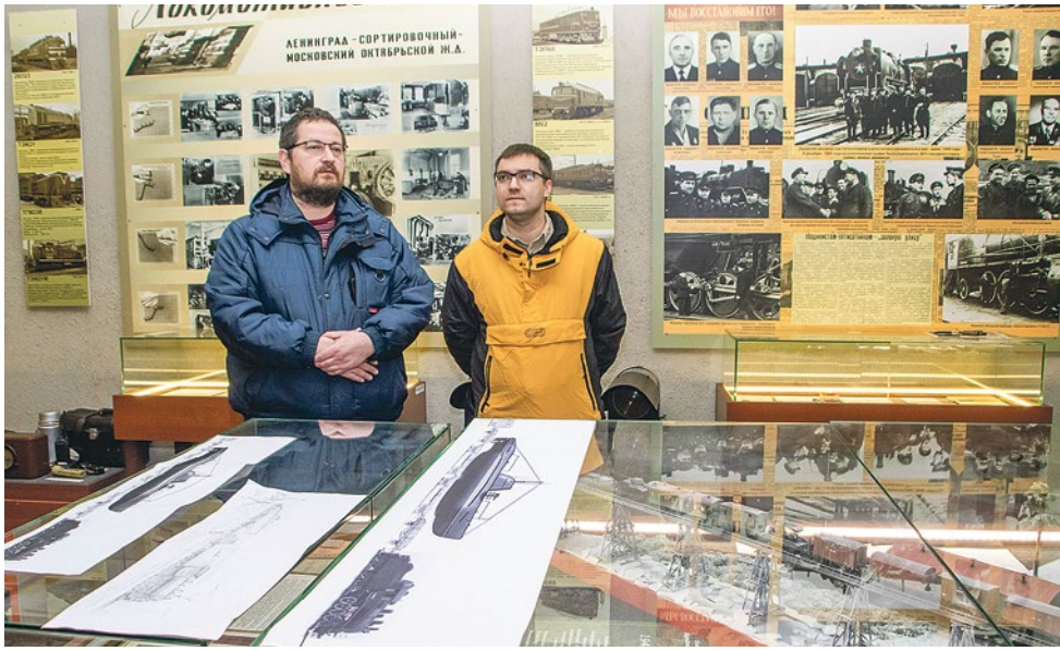
В центре зала – макет железнодорожной переправы через Неву

Паровозное депо Ленинград-Сортировочный-Московский играло важную роль в жизни блокадного Ленинграда. Его работники обслуживали и ремонтировали паровозы, перевозившие грузы со станции Ладожское озеро, а после прорыва блокады в январе 1943 года – по Шлиссельбургской магистрали. Под постоянными обстрелами и бомбежками они водили поезда, доставлявшие в истерзанный город все необходимое для выживания.