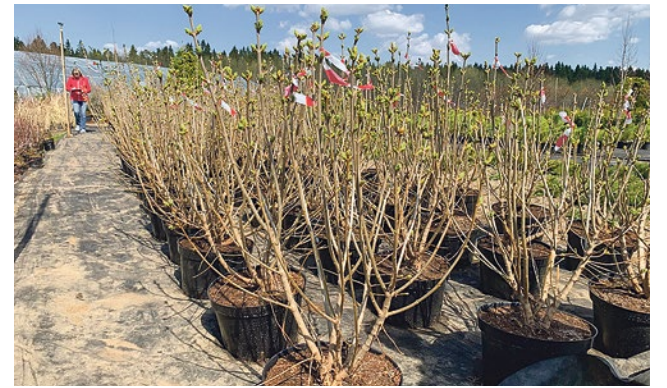
Выбор саженцев в питомнике