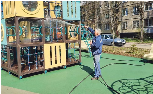
Промывка детских площадок