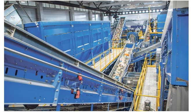
Переработка мусора – долгий и кропотливый процесс, требующий ответственного подхода

М усорный завод не построишь где попало – нужна ровная глинистая площадка, отвечающая всем ГОСТам. И еще нужно договориться с жителями, чтобы не было протестов. Поэтому завод проводит экологические экскурсии, где объясняет: здесь нет ничего опасного.