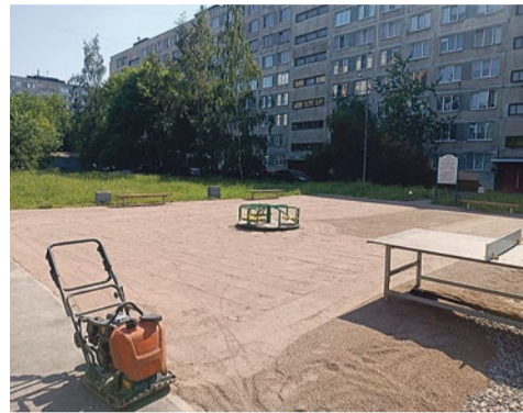
Обновление покрытия на детской площадке на Софийской, 34/2

Санкт-Петербург уже давно не город дождей и туманов. Засушливая весна и жаркое лето заставляют муниципалитет заключать контракт на регулярный