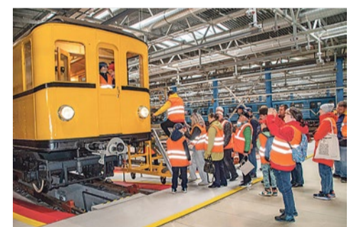
Первые немецкие вагоны метрополитена