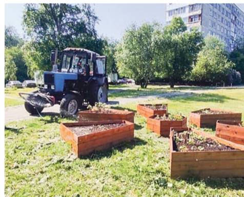
Полив школьного огорода

полив. Трактор с бочкой-прицепом объезжает территорию округа и поливает цветники и молодые посадки.