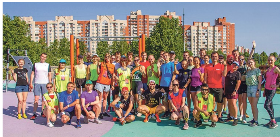
Занятие по танцам в парке Интернационалистов

Лето в муниципалитете № 72 настолько насыщено событиями, что жители иногда теряются в выборе: поиграть в петанк, покататься на кораблике или пойти на концерт? Защищенный от застройки парк Интернационалистов становится полноценным парком культуры и отдыха. Здесь вечерами проходят занятия по йоге и танцам, жители поют караоке, слушают музыку и обнявшись смотрят кино.