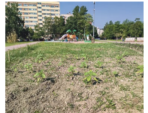
Посадка подсолнечника в Ивовом сквере