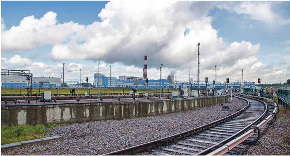
Начало экскурсии – станция «Шушары»

Депо «Южное» – самое большое депо метрополитена в Европе. А также – стратегический объект с предварительной записью, паспортами, рамками на входе. Попасты туда очень непросто, но муниципалитет № 72 смог организовать экскурсию для своих жителей.