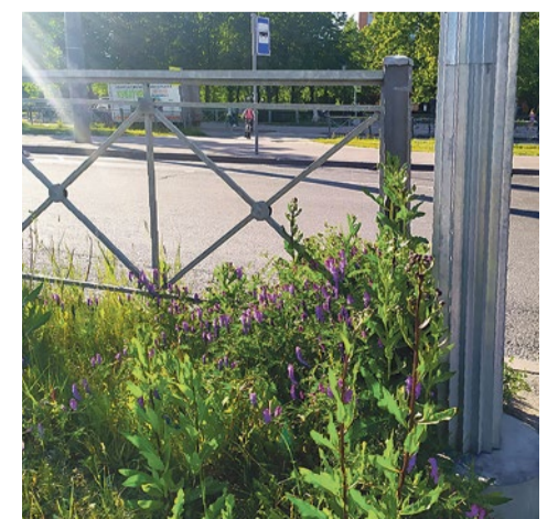
Мышиный горошек на разделительной полосе в Петербурге