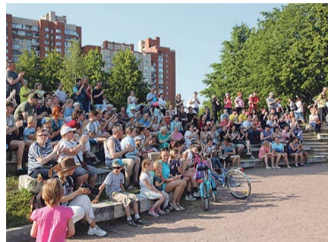
Амфитеатр парка Интернационалистов - неизменное место встречи

Для тех же, кто хочет объять необъятное, составили примерное расписание, куда включены все события недели, полезные для тела и души.