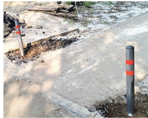
Установка антипарковочных столбиков на Софийской, 35/4

Борьба с любителями припарковать автомобиль на газонах и пешеходных дорожках продолжается. Превращать округ в «территорию заборов» не хочется, поэтому муниципалитет заключил контракт на установку антипарковочных столбиков, полусфер и одного вазона. Вазон появился на Фарфоровском посту, 78.