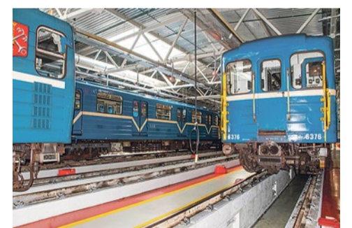
Вагоны современного петербургского метро