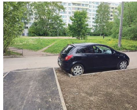
Новый парковочный карман на Турку, 32/4