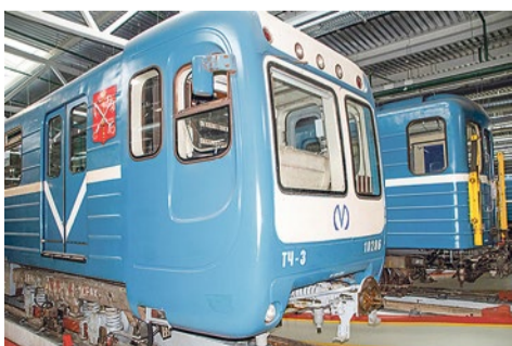
Экскурсия в Музей подвижного состава депо «Южное»

Помещение депо очень просторное, сделано с запасом под восьмивагонные поезда. В стойлах депо много старых поездов, собранных из разных вагонов. Все они без наворотов, зато любой электрик может разобраться в поломке, заменить деталь.