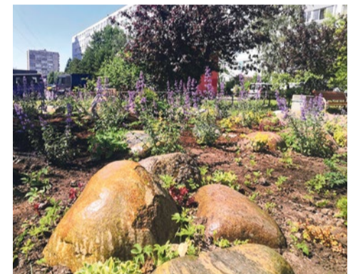
Цветник на проспекте Славы, 38/1