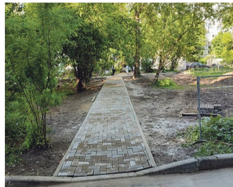
Строительство дорожек на Турку, 28/5