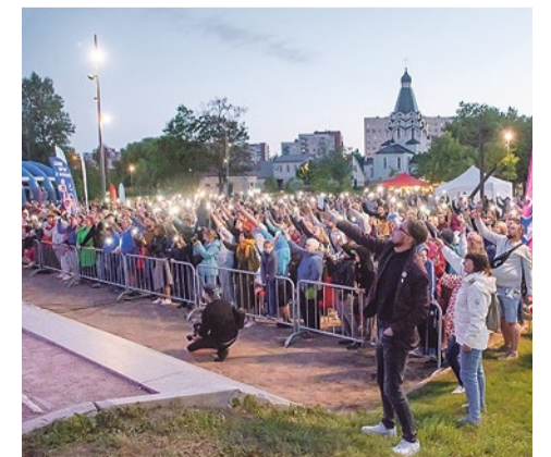
Фестиваль «Белые ночи в Купчино-2022»