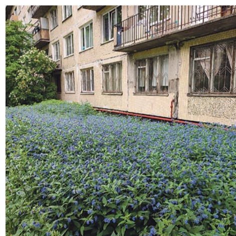
Поляна цветущего окопника на Бухарестской улице, 86/2

В других городах и странах существует такая практика – косить траву только там, где люди ходят, играют, загорают, и оставлять высокие травы на транзитных зонах: вдоль трамвайных путей, автомобильных дорог, рядом с деревьями вдоль тротуаров.