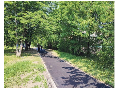
Асфальтирование пешеходной дорожки к школе № 316

Завершены работы по рубке сухих и аварийных деревьев и удалению пней. Сухостой убран по адресам: Бухарестская улица, 86/1, 86/3, 90, 94/1, 94/4, Фарфоровский пост, 34, 44, 54, 70, 74, 76, 84, улица Турку, 19/1, 19/2, Софийская улица, 20/1, 20/3, 32/1, 32/3, 32/4, 34/2, 40/1, 40/2, 40/3, 40/4, 48/1, 48/3, 50, улица Турку, 15/2, 17/1, 19/3, 23/3, улица Бельи Куна, 27/1, проспект Славы, 38/2, 40/3. Всего спилено 109 сухих деревьев.