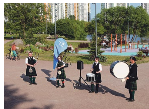
Выступление группы «Волянки и барабаны»

По пятницам Молодежный совет иногда устраивает для жителей игры на открытом воздухе. Молодые люди собираются в парке и играют в любимые настолки, разложив их на покрывалах.