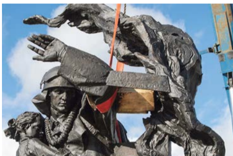
Установка памятника Героям-пожарным.