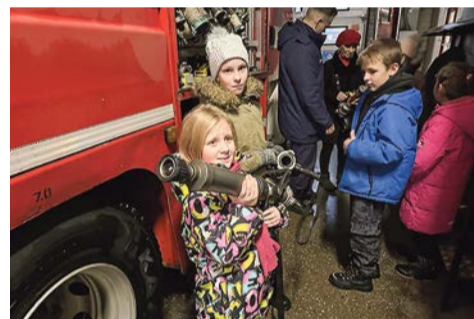
Дети на декабрьской экскурсии