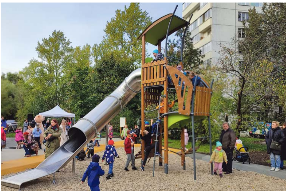
Открытие площадки на Турку, 22/5

В 2022 году городские и районные службы реализовали на территории муниципального образования № 72 несколько проектов, рассказываем о них подробнее.