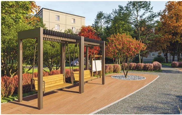
Проект площадки на Турку, 22/5

Самая большая статья расходов бюджета муниципалитета – благоустройство. Ежегодно в округе ремонтируются и строятся новые площадки, которые должны быть интересными современному ребенку, безопасными и соответствовать современным стандартам. Муниципалитет № 72 старается с особым вниманием подходить к каждому проекту, делать его оригинальным и уникальным, учитывая пожелания жителей. Требования к покрытию детских площадок постоянно меняются, многие материалы пока являются довольно непривычными.