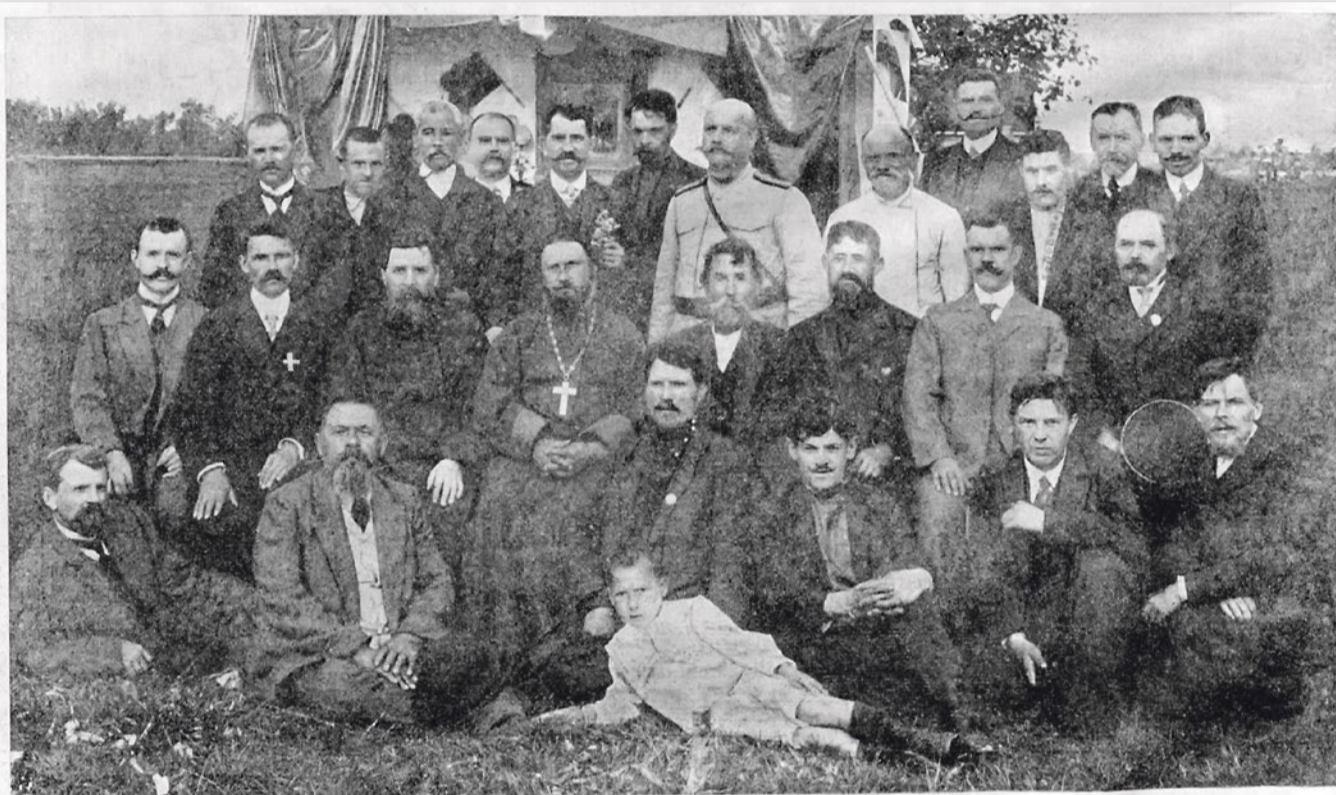
Группа лиц, присутствовавших на открытии села «Романова», близ ст. «Фарфоровский пост» Николаевской жел. дор., основанного в память 300-летия Дома Романовых.

Топонимика как наука, несомненно, является частью истории. Изучая древние и не очень названия, можно делать выводы об эволюции территорий и отдельных географических объектов. Нередко топонимика идет и рука об руку с политикой, увековечивая в названиях людей, места и события, почитаемые в некий отрезок времени. И по прошествии лет такого рода конъюнктурные топонимы тоже становятся частью истории. Истории, отражающей свое время.