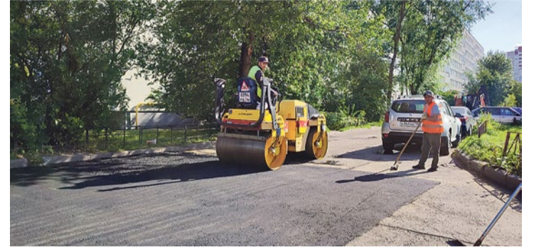
Ремонт проезда на Софийской, 30