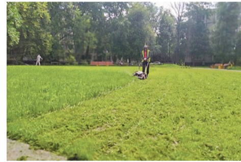
Покос газона на Софийской, 35/4