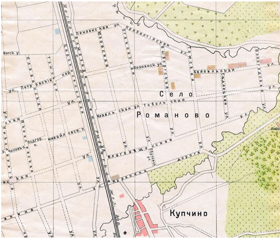
Фрагмент карты Санкт-Петербурга 1913 г. издательства А. С. Суворина

собственноручно начертал на прошении «искренно всех благодарю», поддержав и одобрив таким образом народную инициативу. Оригинальный документ с резолюцией Самого не сохранился, но описание этого факта отмечено в ряде официальных бумаг, и ныне находящихся в архивах.