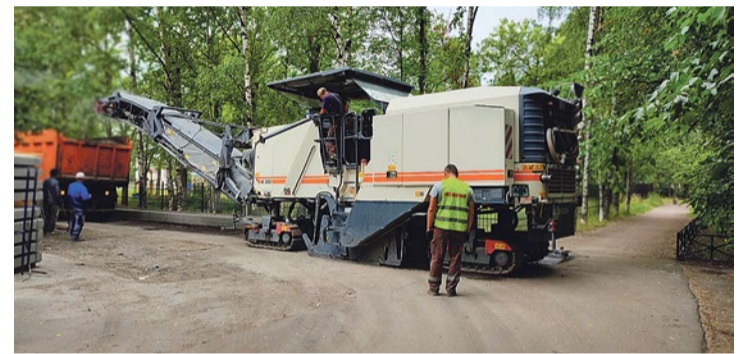
Реконструкция проезда на Турку, 21