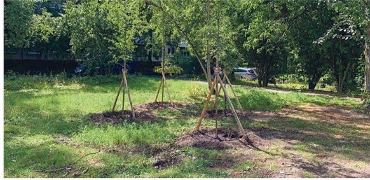
Посадка деревьев на Турку, 32/4

Началась реконструкция двора на Софийской улице, 40/1. Проект разбит на 2 этапа. В этом году будут построены пешеходные дорожки, подготовлено основание детских и спортплощадок, построена центральная аллея, установлены скамейки и урны. Завершение первого этапа ожидается в октябре 2023-го. В рамках второго этапа запланированы установка оборудования и ремонт проезда. Второй этап планируется реализовать в 2024 году при условии получения субсидии из бюджета Петербурга.