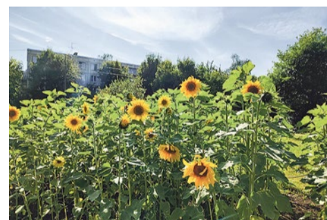
Подсолнухи на Злаковом поле на Бельи Куна, 27