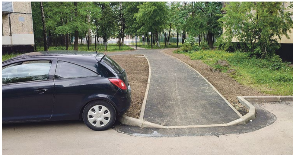
«Островок безопасности» на Турку, 32/4

Сейчас уровень автомобилизации в Петербурге составляет 30%, это значит, что 30% жителей города имеют в собственности автомобиль. В Европе таковых 80–85%. Есть также показатель «автомобилепользование»: сколько из владеющих автомобилем им пользуется. В России такой статистики нет, но мы понимаем, что автомобилепользование ниже автомобилизации. Общественным транспортом пользуется