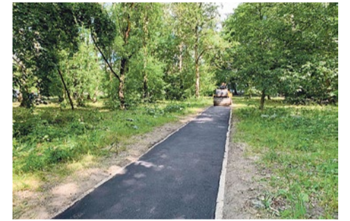
Асфальтирование дорожки к школе № 303