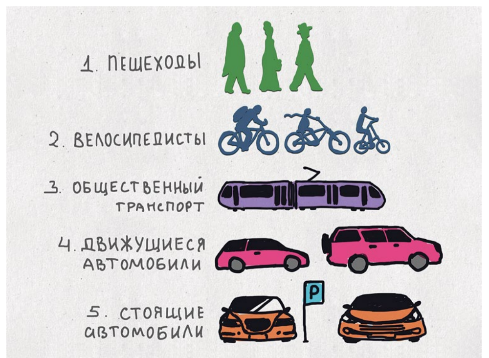
Приоритет в городе – пешеходы

В новых жилых комплексах есть подземные паркинги, и автомобилистам следует покупать там места. У нас почему-то считается, что парковка – это социальная гарантия. Нет. Перед покупкой автомобиля нужно подумать, куда вы будете его ставить. Если есть проблема с парковочным пространством, задумайтесь, нужен ли автомобиль. Например, в Японии, чтобы купить автомобиль, обязательно иметь парковочное место. Многие возражают: не стоит сравнивать Россию и Японию по площади. Но речь идет о городах, а города по площади и плотности населения примерно равнозначны.