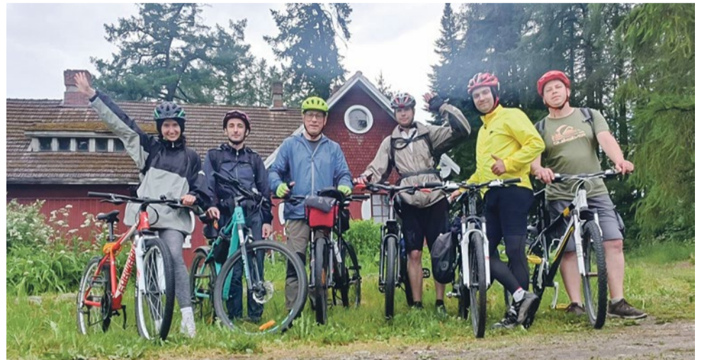
Дом-музей «Усадьба Ларса Сонна», Куркиени, 1914 года постройки

Третий выезд велоклуба был посвящен осмотру фонтанной водной системы