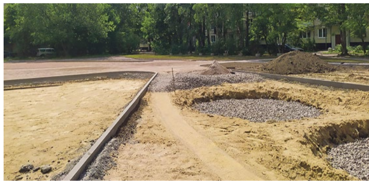
Строительство площадки на Турку, 22/5