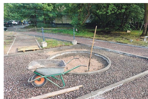
Благоустройство площадки с инновационным покрытием завершится в сентябре 2023 года

Строительство новой детской площадки уже началось, работы будут завершены в сентябре. По проекту здесь