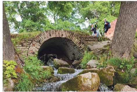
Луговой парк, Петергоф