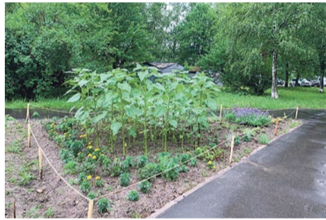
Клумба на Софийской

Прополка и регулярный полив – вот что нужно цветникам в летнюю жару. А еще – защита от нерадивых горожан, которые то вытопчут посадки, то выкопают куст или декоративный многолетник. Но несмотря на все невзгоды, радуют глаз наши цветники на проспекте Славы, 38/1, Бухарестской улице, 86, на детской площадке на Софийской улице, 20/3, рокарий на проспекте Славы, 40, цветник с подсолнухами на Пижонской улице, 25, Цветочный луг у Злакового поля на улице Бельи Куна, 27, цветник у муниципалитета на Пижонской улице, 35, газон и цветник в зоне отдыха на Софийской улице, 35/4.