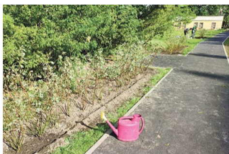
Посадка кустарников на Софийской, 34/2