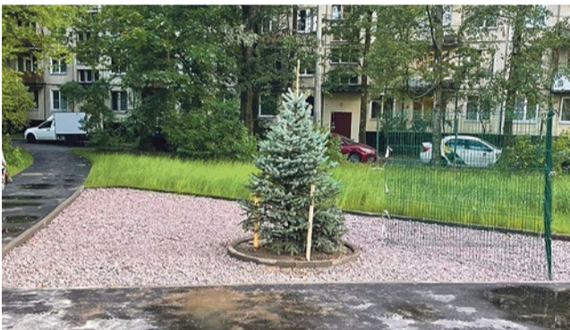
Ель во дворе дома 22/5 по улице Турку