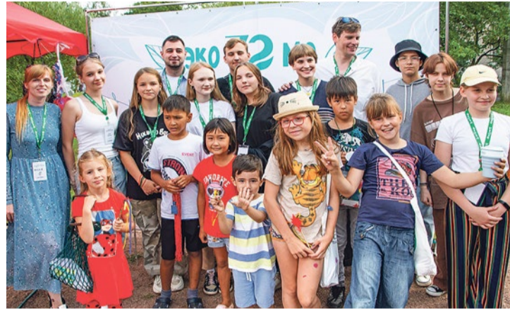
Почти любой пластик можно переработать, главное – знать как

«Какие отходы скапливаются в океане?» – продолжается викторина. Конечно, пластик, образующий мусорные острова. А ведь он достоин лучшей жизни! «Самый пригодный для