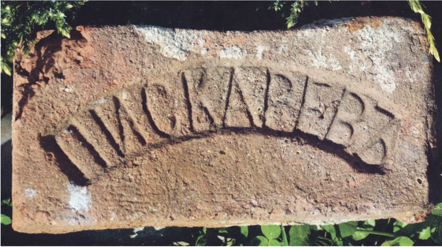
Кирпич производства завода Пискаревых

для рабочих, также предписывалось контролировать оных тружеников на предмет трезвого образа жизни. В документах отмечается, что поскольку ожидается застройка прилегающих участков жильем, необходимо, чтобы «от производства не заражался воздух и не причинялось беспокойства окружающим жителям».