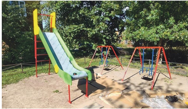
Установка горки на Фарфоровском Посту, 64