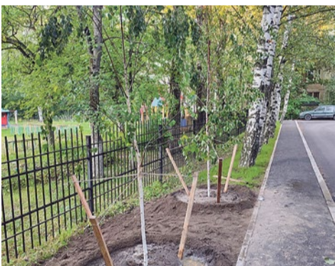
Посадка берез на улице Турку, 21