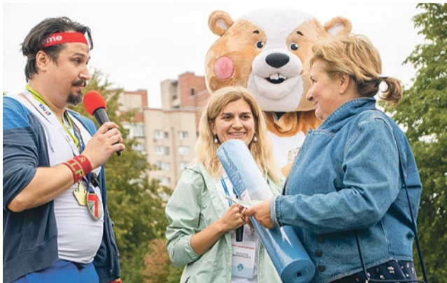
Квест ко Дню физкультурника включил в себя пять станций

19 августа в парке Интернационалистов прошел спортивный праздник, приуроченный ко Дню физкультурника. На мероприятии каждый желающий проверил свою силу, выносливость и ловкость, а также наслаждался яркой культурной программой. Впервые День физкультурника состоялся в нашей стране 18 июля 1939 года, а теперь традиционно этот праздник отмечают в заключительный месяц лета.