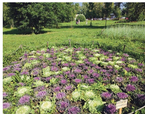
Урожай на Злаковом поле на Софийской, 20/4