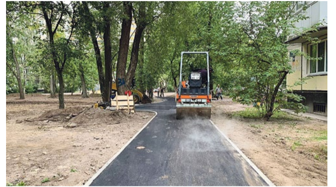
Реконструкция пешеходных дорожек на Софийской, 38/1