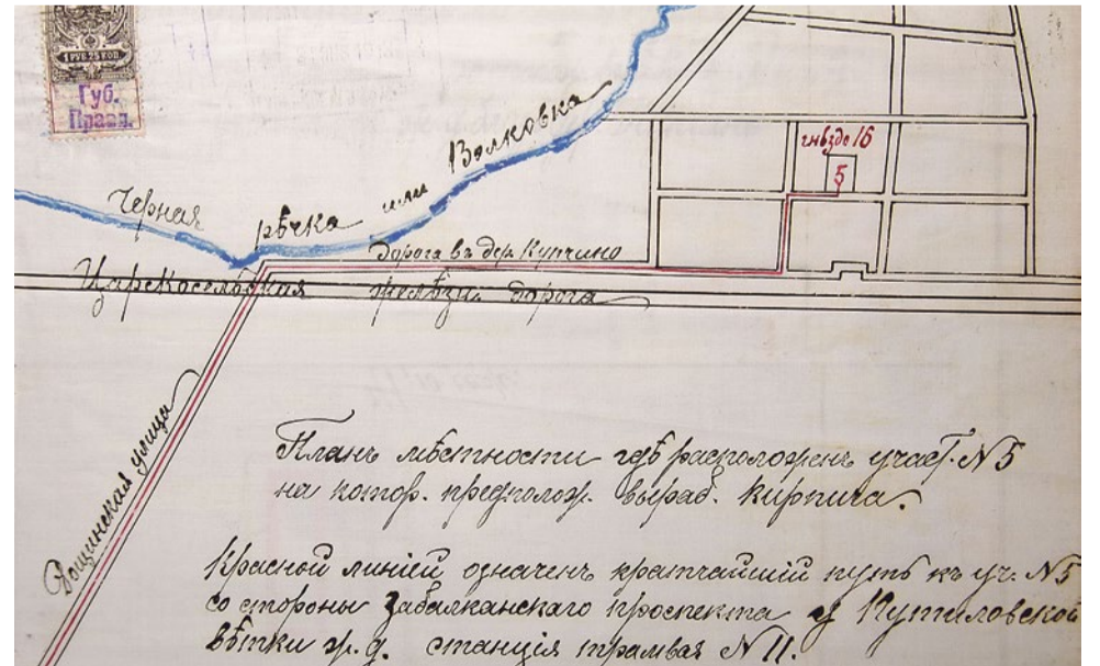
План местности, где расположен участок № 5, на котором предположительно вырабатывается кирпич. 1912 год