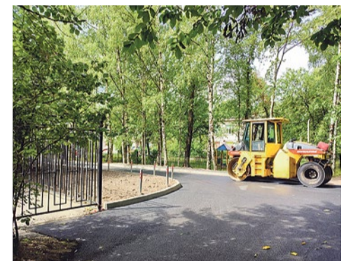
Реконструкция проезда на улице Турку, 21