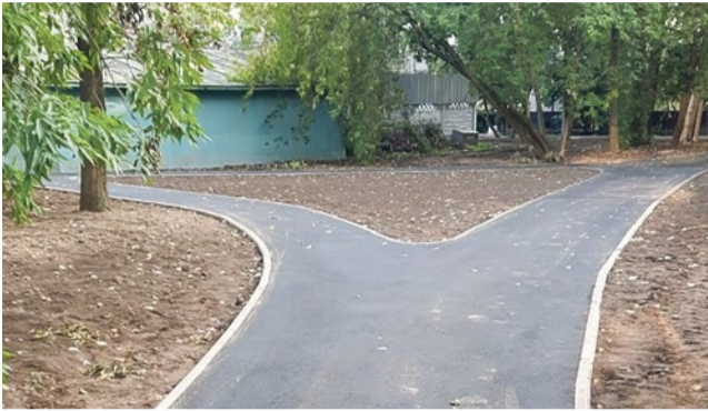
Асфальтирование пешеходных дорожек на Софийской, 38/1

Пока школьники и отпускники наслаждались последним месяцем лета и заряжались солнечной энергией и витаминами, сотрудники муниципалитета не покладая рук трудились в сфере благоустройства. На одном объекте стройка завершается, и нужно привести территорию в порядок и принять у подрядчика работу, на другом – находится в самом разгаре, а третий объект только сдается в работу. Все успеть и ничего не упустить – в таком режиме проходит в округе август.