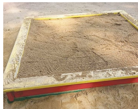
Замена песка в песочницах