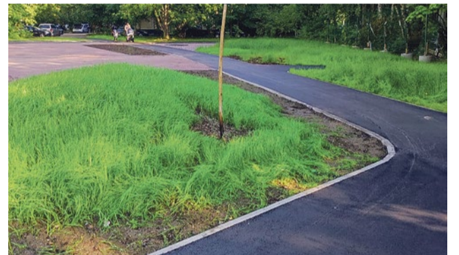
Устройство пешеходных дорожек на улице Турку, 22/5