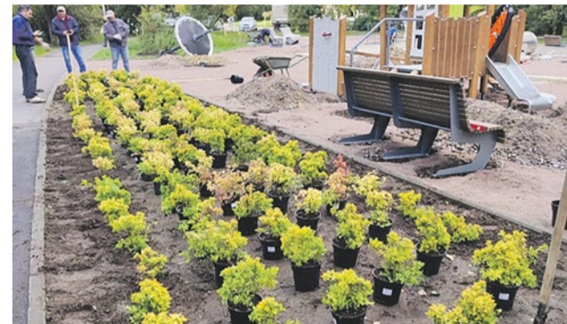
Посадка спиреи японской на Турку, 22/5