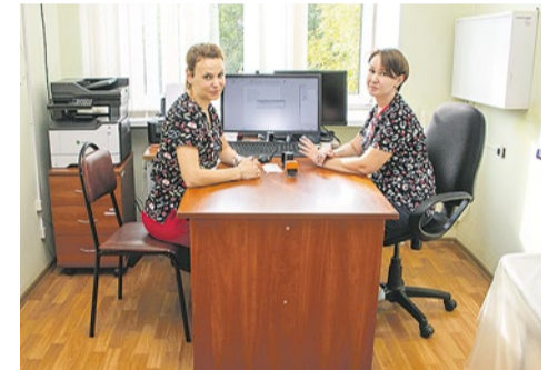
В детском отделении поликлиники