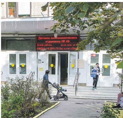
Вход в детскую поликлинику