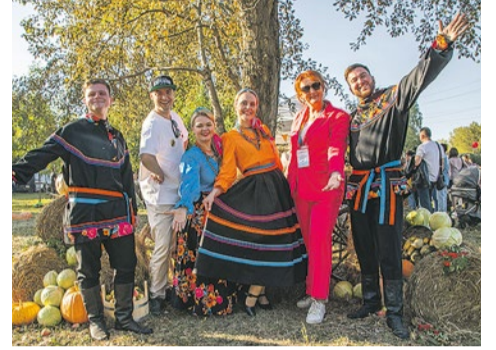
На фестивале «Купчинский кочан - 2023».

Воспоминания о третьем ежегодном фестивале «Купчинский кочан» еще долго будоражили купчинцев. Они делились фотографиями с гулянья, хвастались друг перед другом поделками, созданными на творческих мастер-классах, лакомились блюдами, приготовленными дома из принесенной