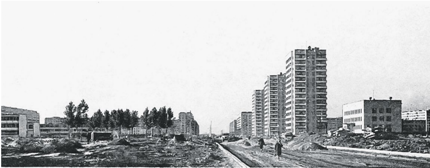
Пращская улица, вид на север 1971 год.

Городская поликлиника № 56 на Пращской улице открылась 30 сентября 1968 года. Она развивалась вместе с нашим районом, и какие перемены ни происходили бы вокруг, здесь всегда оказывали помощь взрослым и детям, стремясь сделать ее как можно лучше и качественнее.