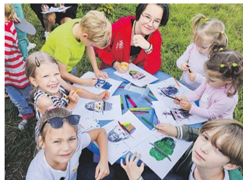
На празднике «Костры рябин» в парке Интернационалистов. 2 сентября 2023 года