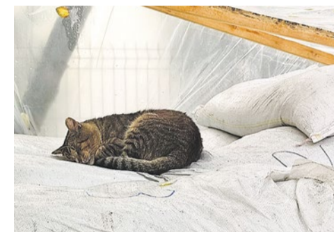
Охранник строительных работ МО 72