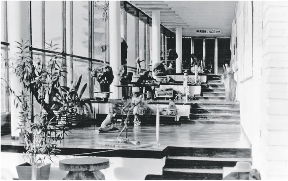
Скульптуры А. Я. Егорова.

киножурналы. Правда, просуществовал этот «общественный экран» недолго. Впоследствии на него много лет приклеивали различную рекламу. Теперь экрана нет, снесли, а отверстие в стене заделали.