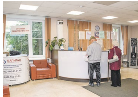
В регистратуре взрослого отделения