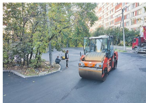
Асфальтирование проезда и парковки на Турку, 24