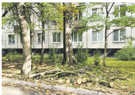
Рубка сухих деревьев на Турку, 22/3 и 22/4