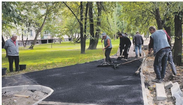
Асфальтирование пешеходных дорожек на Софийской, 40/1