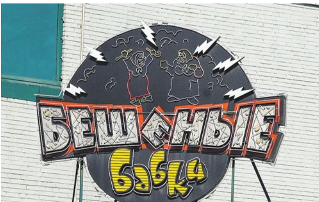
Фото: Денис Шаляпин, 2009 год

Волна комментариев захлестнула страницы интернет-сообществ. Основная мысль: это поджог. Весьма вероятно. Хотя если и представить, что возгорание произошло случайно, этому сейчас никто не поверит. Уж очень «вовремя» сгорел кинотеатр. Теперь владельцам здания и территории останется только убрать угли и можно начинать строительство. Разумеется, представитель собственника опроверг версию о поджоге. Следствие