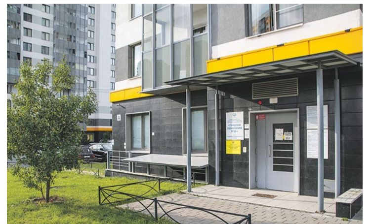
Отделение поликлиники № 56 в ЖК «София»