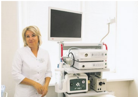
Новое оборудование детского отделения