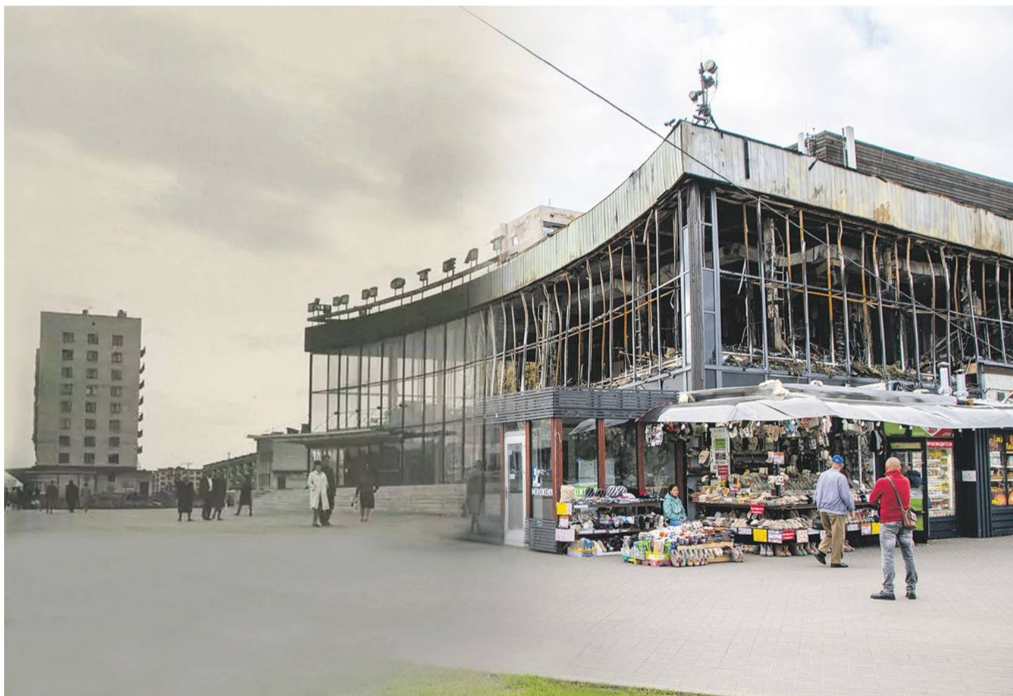
Фотоколлаж. Ленинград, 1969 год (Л. Зиверт) / Санкт-Петербург, 2023 год (О. Ясененко).