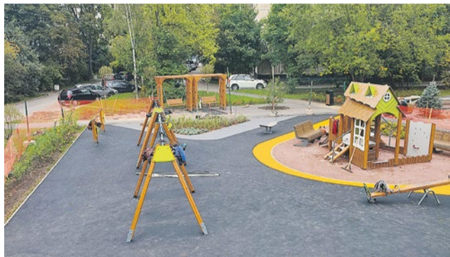
Строительство детской площадки на Турку, 22/5

Главным результатом сентябрьского благоустройства должно было стать открытие новой детской площадки на улице Турку, д.22/5. К сожалению, монтаж игрового оборудования и уличной мебели затянулся. Но несмотря на все сложности, работы выходят на финишную прямую, и уже 5 октября в 16:00 новая детская площадка будет торжественно открыта.