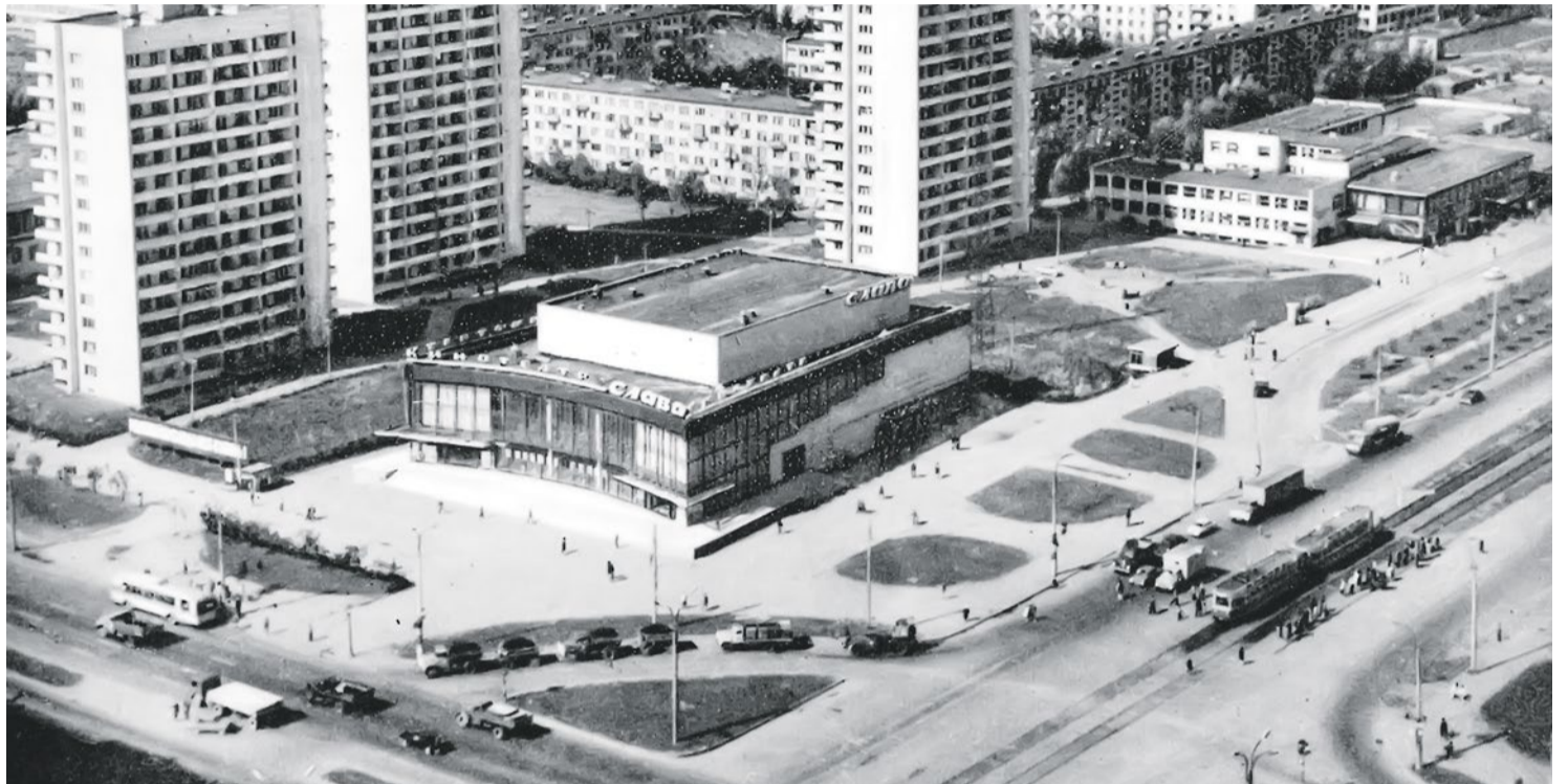
Перекресток проспекта Славы и Бухарестской улицы, Историко-географический атлас, 1977 год

Купчинские дети, не избалованные и достаточно самостоятельные, бегали в «Славу» регулярно. Кассы были по обеим сторонам кинотеатра, с запада и с востока. Не совсем понятен смысл разделения касс на дневные и вечерние. На Бухарестскую улицу выходила вечерняя касса. У касс были большие застекленные витрины. В них, разумеется, вывешивались афиши, информирующие