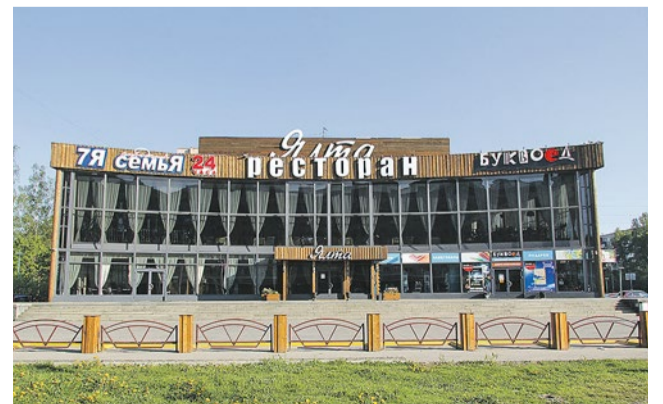
Фото: Денис Шаляпин, 2012 год