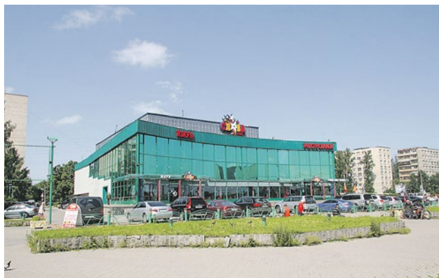
Фото: Денис Шаляпин, 2009 год