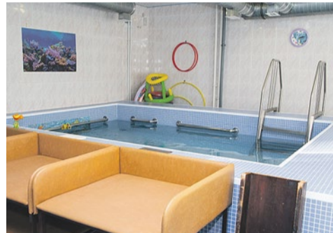
В бассейне для грудничков