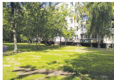
Прорастающий газон на Софийской, 38-40