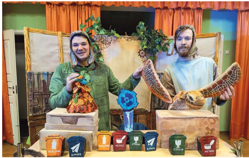
Спектакли театра «Небесные бродяги»

Полезные привычки, в том числе экологические, важно сформировать в детстве. Для этого в школах округа организованы экологические спектакли. В гости к школьникам приехали актеры театра «Небесные бродяги» и показали веселый интерактивный спектакль, во время которого можно и пошуметь, и подурчиться, воюя с Мусорным монстром. Спектакль отсылает нас к знаменитой повести Антуана де Сент-Экзюпери «Маленький принц» – повести о любви к миру и ответственности за свою планету.