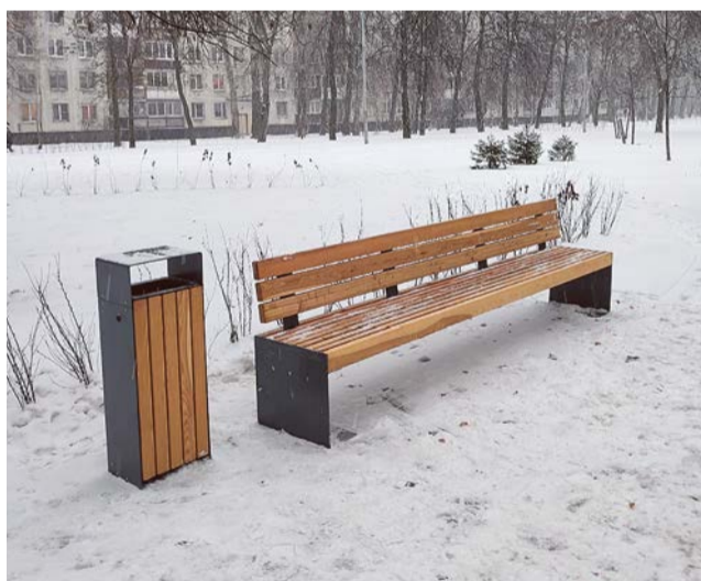
Установка скамеек на Софийской, 40/1