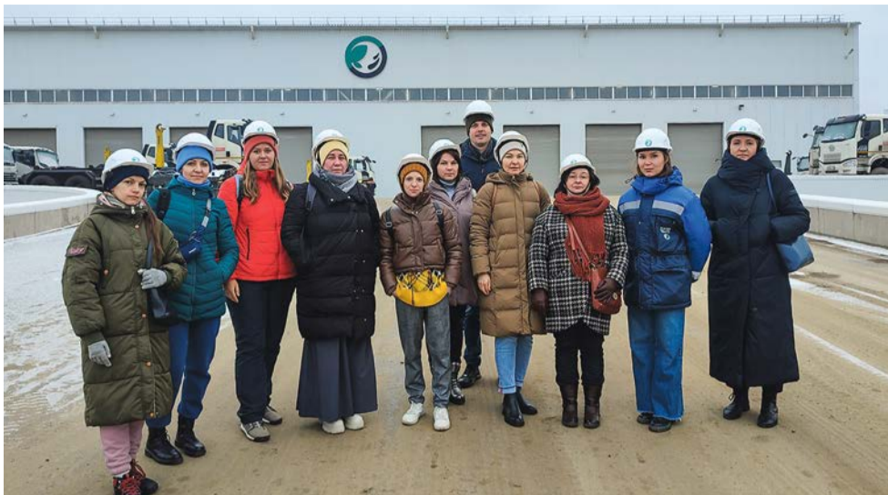
Участники экскурсии на КПО «Волхонка»

предусмотрены острые лезвия. Затем мощным магнитом из общей массы извлекаются металлические элементы.