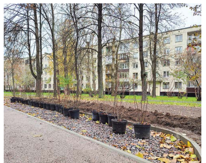
Посадка кустарников на Софийской, 40/1