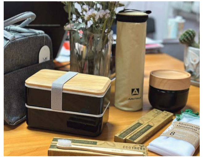
Призы участникам экомарафона