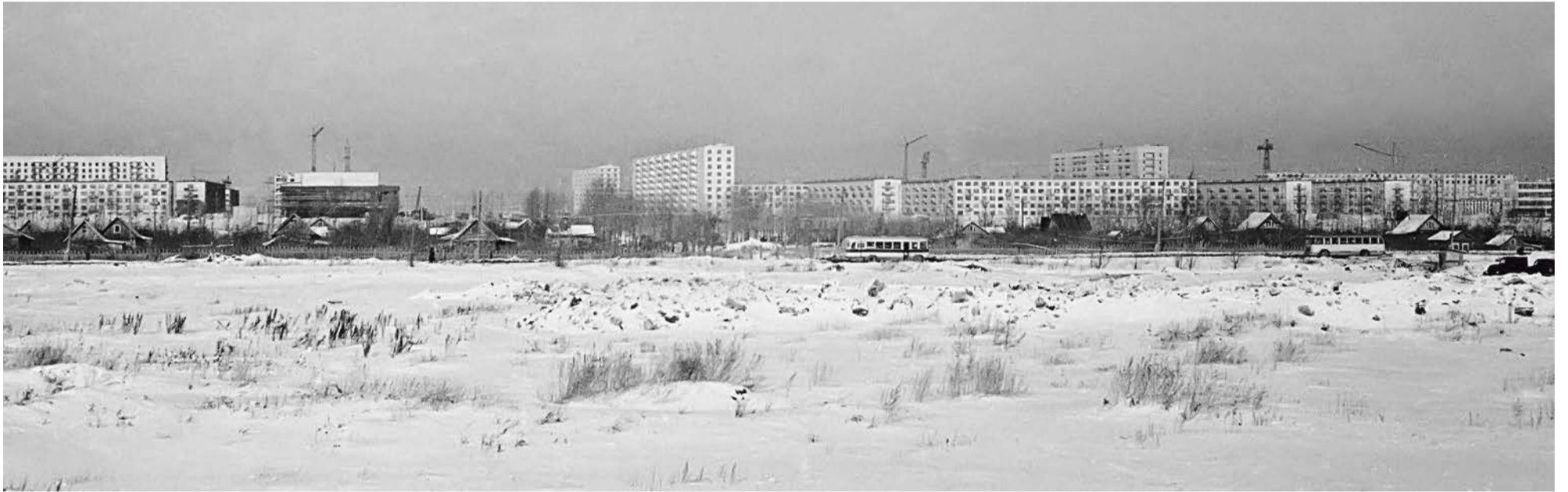
Северное Купчино. Вид на север, на Южное шоссе и проспект Славы. Февраль 1967 г.