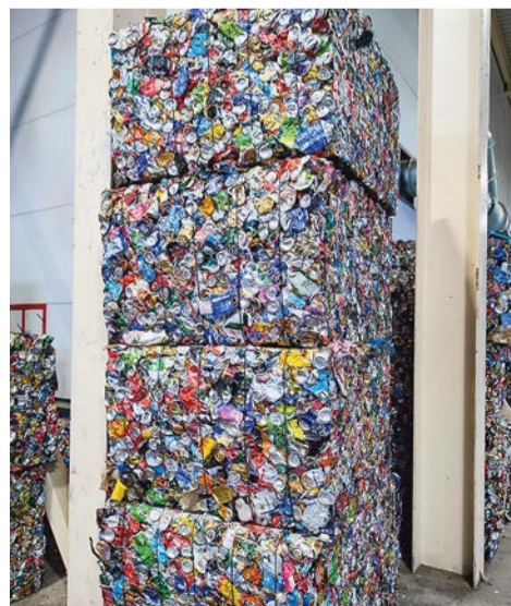
Сырье, подготовленное к отправке на переработку

Многое после экскурсий стало ясно, как собираются отходы, кем и куда вывозятся, кто отвечает за логистику и тарифы, сколько полезного сырья можно извлечь из смешанных отходов, а сколько – из отдельно собираемых. Но главное, что работа с отходами – это тяжелый и часто неблагодарный труд, который, вне всякого сомнения, достоин уважения.