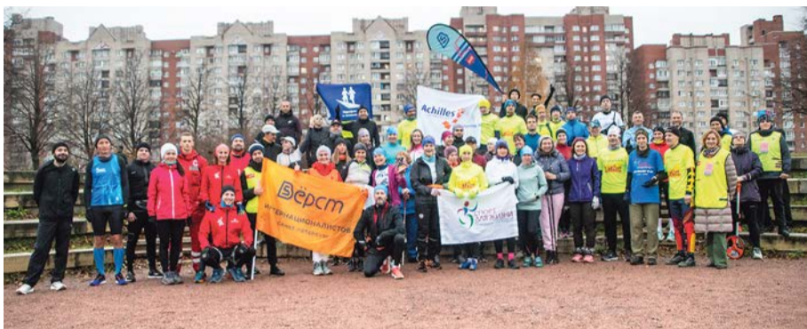
Участники проекта «Марафон в темноте» на старте забега

13 ноября – Международный день слепых. Праздник людей, готовых несмотря на трудности жить полноценной жизнью – работать, путешествовать, заводить друзей и иметь разные увлечения. Многих из них вдохновляют занятия спортом!