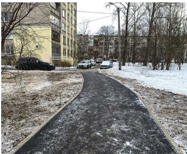
Новая дорожка на Турку, 15/1