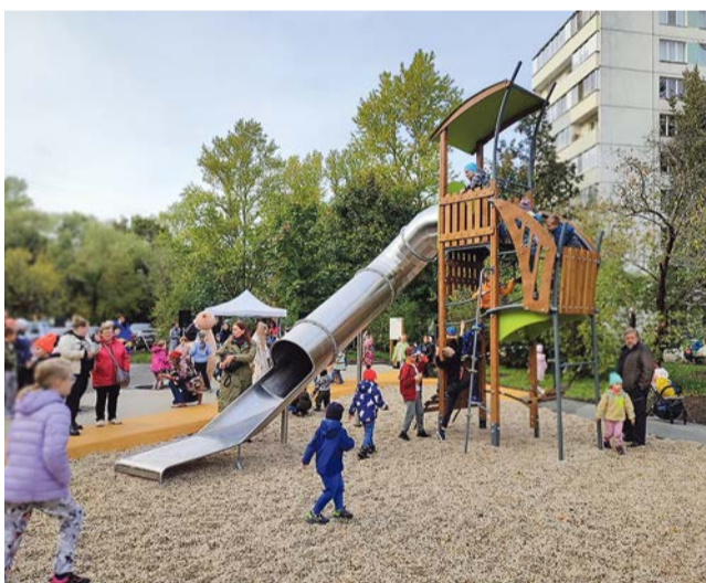
Площадка-победитель в конкурсе на лучшее благоустройство

Площадка построена за счет бюджетов Петербурга (62%) и муниципалитета (38%).