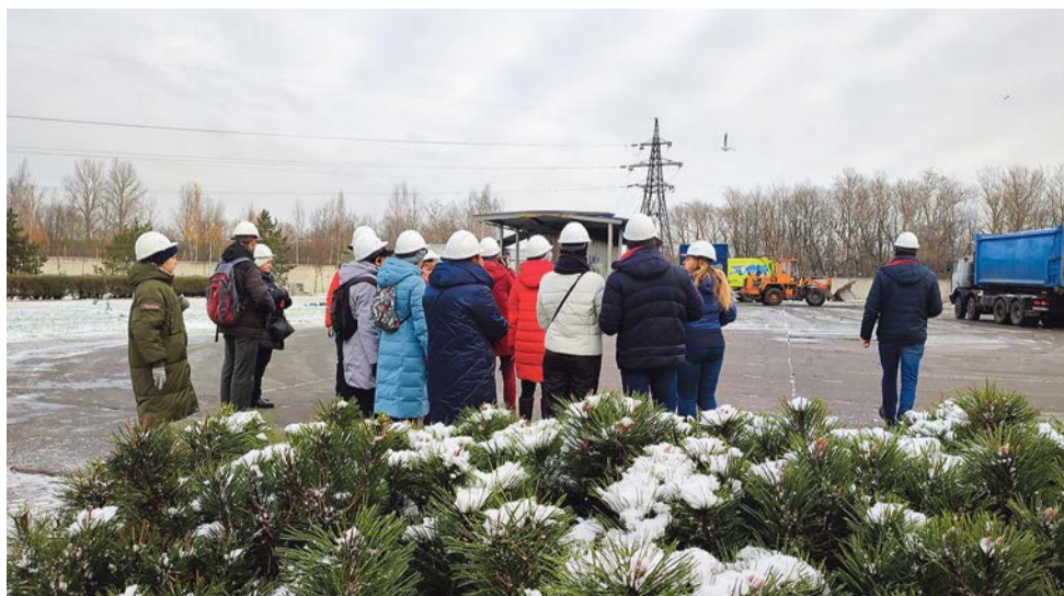
На территории КПО «Обухово»

До 30-х годов прошлого века во дворах Ленинграда стояли специальные «мусорные домики», содержимое которых вывозилось конным транспортом в 400-литровых деревянных бочках. Тогда отходы были в основном органическими. В 1936 году в рамках Треста очистки создается Автопарк № 1 – началась механизированная уборка Ленинграда. Отходы вывозятся бортовыми машинами ГАЗ-АА. В 1947 году автопарк пополняется новыми автомобилями ЗИС-5 и ЯЗ-6, в 1952 году автопарк увеличивается до 180 машин. В 1960 году предприятие располагает 400 единицами спецтехники, в 1963-м – 500, в 1974-м – 750. Из истории видно, как стремительно увеличиваются запросы мегаполиса на вывоз отходов. К производственному эксперименту по внедрению раздельного сбора предприятие подключилось в 2005–2006 годах, в 2009–2010 годах впервые в России наладило производство твердого топлива из отходов, в 2015-м опробовало станцию активной дегазации полигона с генерацией электроэнергии.